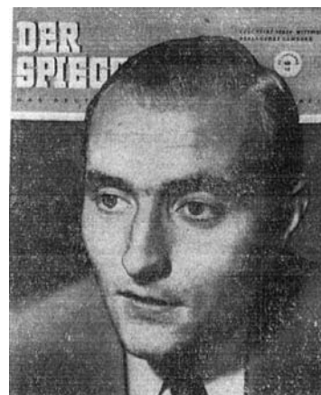
רודולף אוגשטיין בצעירותו

אש"ף יאסר ערפאת באינתיפאדה השנייה. תקיפתו גררה מחאה ישראלית נמרצת בשל ההשוואה, גם אם העקיפה, של אוגשטיין בין פועלו של שרון למעשי היטלר בעבר. אוגשטיין, שלאחר כינון היחסים הדיפלומטיים בין גרמניה לישראל דגל ביחסים נורמליים בין גרמנים ליהודים, שלל את הימנעות השלטונות הגרמניים ודעת הקהל הגרמנית ממתחת ביקורת על מדיניותה של ישראל אך ורק בגלל האחריות הגרמנית לשואה. 32 אולם גם אם הביקורת החרפה של אוגשטיין דמתה לא אחת לזו של קולות אחרים במערב, ישראל לא הייתה מוכנה לעבור על כך לסדר היום, בפרט שלפעמים היא לוותה ברמזים אנטישמיים.