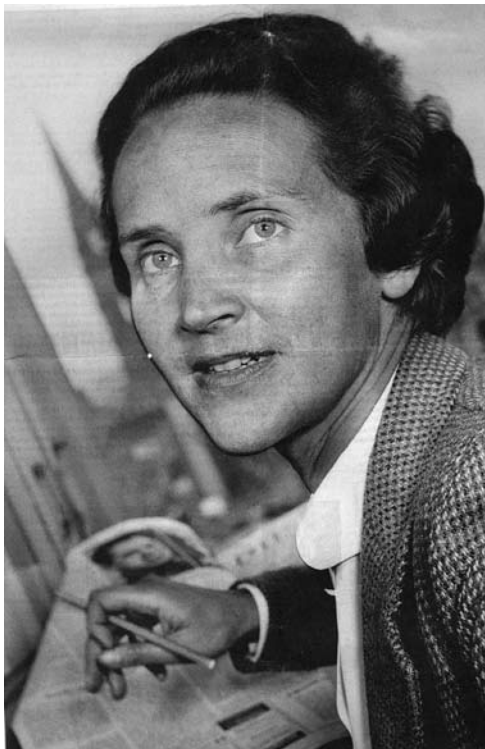
מירון דנהוף, 1955

המערב. היא הגישה לשלטונות הבריטיים גילוי דעת שניסחה יחד עם גוטפריד פון קראם, הטניסאי הגרמני המפורסם בשנות השלושים, שגם הוא לא הצטרף למפלגה הנאצית. בגילוי הדעת ביקשה להעלות על נס את פועלה של האופוזיציה הגרמנית, ובעיקר את קושרי ה־20 ביולי 1944, בעיני הבריטים הספקנים.